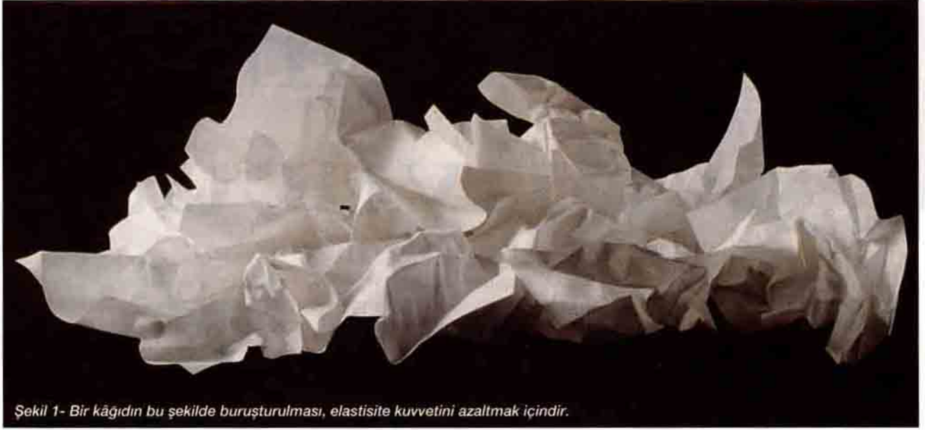
Şekil 1- Bir kâğıdın bu şekilde buruşturulması, elastisite kuvvetini azaltmak içindir.

Elbetteki esneklik ve yüzey teorisi arasında bir bağ kurulacaktır. Buna göre, ince bir levhayı deforme ederken eğer uzunlukları değiştirmiyorsak, onun esneklik enerjisini en düşüğe tutuyoruz demektir. Şimdi bir düzlemi, açınabilen bir yüzeye (Gauss eğriliği her yerde sıfır olan bir yüzeye) taşıyalım (bir kâğıdın bir silindire sarılmasında olduğu gibi). Böyle bir deformasyon karşısında son derece ince bir levha da esneklik kuvvetleri hemen hemen sıfırdır. Gerçekte, levhanın kalınlığı tam olarak sıfır olmadığı için, iç yüzeylerde sıkışma, dış yüzeylerde ise genişleme olması nedeniyle meydana gelen basınç ve çekme kuvvetleri çok küçüktür.