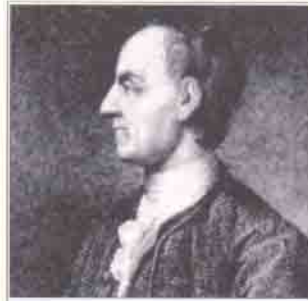
Leonhard Euler (1707-1783)

Öte yandan Goldbach, bununla da yetinmemiş, biri çıkar da kanıtlayın diye ortaya bir sav daha atmış: "7'den büyük her tek sayı 3 asal sayının toplamı olarak yazılabilir." 1937'de Vinogradov veterince büyük sayılar için bu savın doğruluğunu kanıtlamıştır, burada yeterince büyük sayı olarak 3^{31} sayısının alınabileceği gösterilmiştir. Ancak gerisi, yani, 7 000 000'un üstünde başamağa sahip olan bu sayının altındakiler için matematisel bir kanıt yoktur. Fakat, ilerde gelişmiş bilgisayarlar kullanılarak bu sayılar kontrol edilebilir.